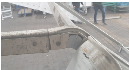
Foto frame / gevelzeil.