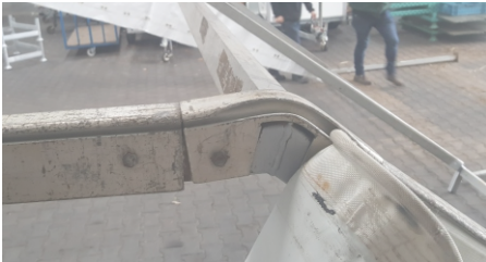
Foto frame / gevelzeil.